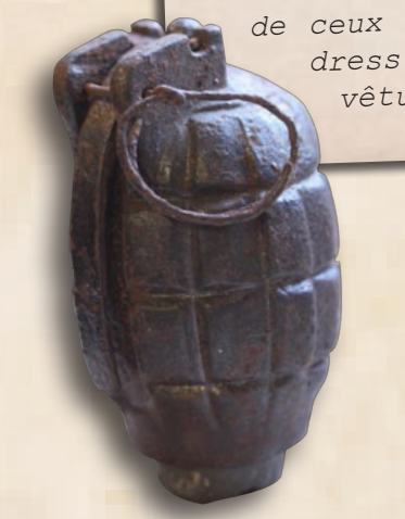
Grenade quadrillée anglaise « Mills » Collections publiques