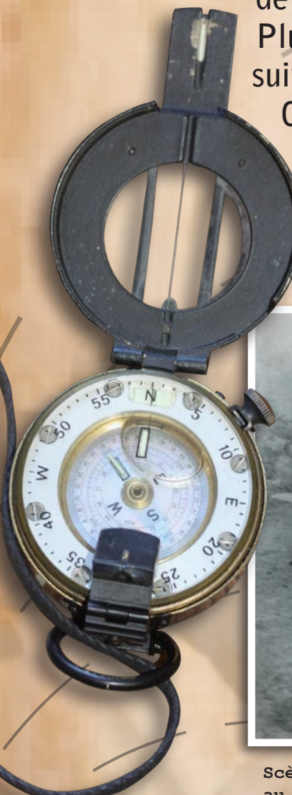
Boussole anglaise MK1 Collections publiques