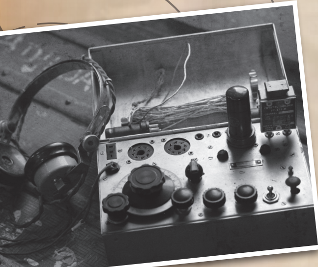
Radio poste émetteur-récepteur de type « Faraset » Collections publiques - photo V.A.