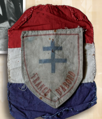
Brassard de résistant FFI du « Maquis de Scévollès » collection privée