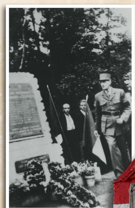
Le général de Gaulle devant la stèle de Scévollès. Juillet 1948.