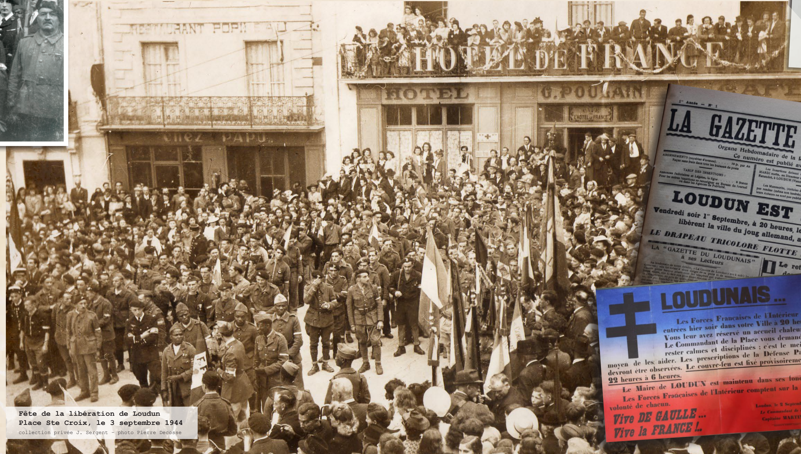
Fête de la libération de Loudun Place St Croix, le 3 septembre 1944