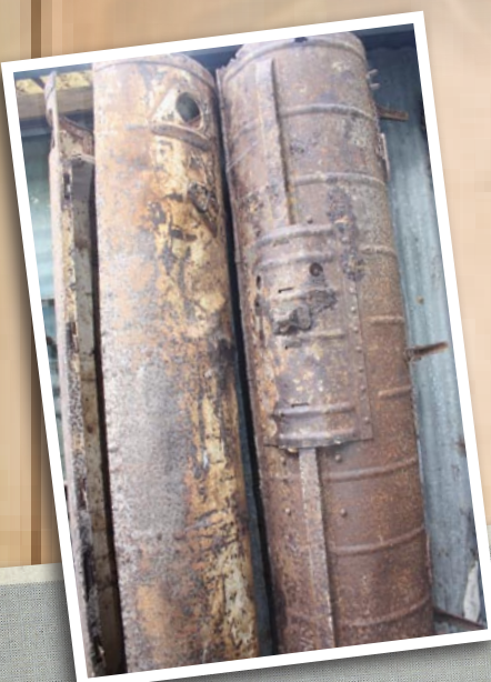
Containers d'armes parachutés en août 1944 ayant été cachés dans les caves de Dandésigny.